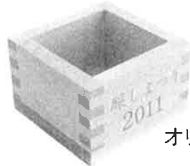
限定 オリジナル 利き枡

秋田県内すべての酒蔵のお酒が飲めます! オリジナルロゴ入り! 限定ミニ利き枡で全40蔵の地酒が試飲し放題!! ~あなたのお気に入りの地酒を見つけましょう♪~