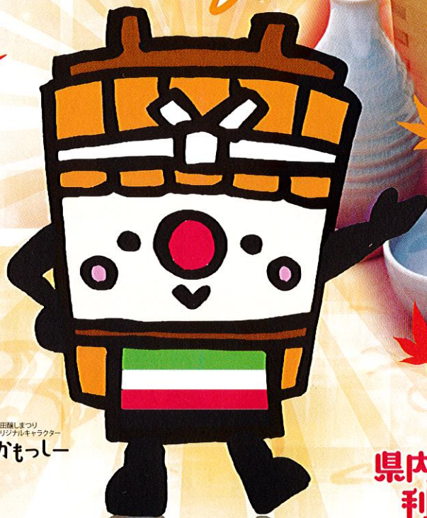
秋田醸しまつり オリジナルキャラクター かもっしー